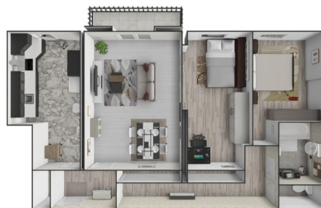
Plan non contractuel - Mesures et indications données à titre indicatif